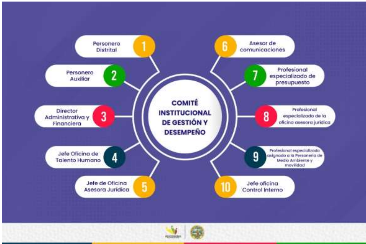
Ilustración 1. Conformación del Comité Institucional de Gestión y Desempeño de la Personería – Articula para la implementación del PGD

actualizar el Plan Institucional de Archivos, el cual incorporará las actividades descritas en el documento, y a su articulación con los planes institucionales y estratégicos de la Entidad, de conformidad en el artículo 2.2.22.3.14 del Decreto 1083 de 2015.