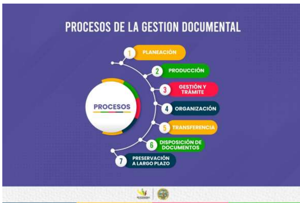
Ilustración 2. Proceso del Programa de Gestión Documental de la personería Distrital de Cartagena

El Programa de Gestión Documental de La Personería Distrital de Cartagena de Indias, contempla en este capítulo, las estrategias de formulación e